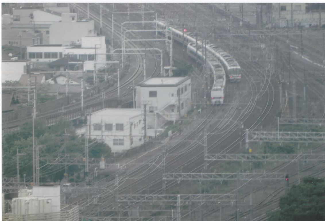
Поглед према западном улазу у станицу Кјото (из правца Осаке). Два типична јапанска воза који саобраћају на старој мрежи пруга узаног колосека ширине 1 067 mm.