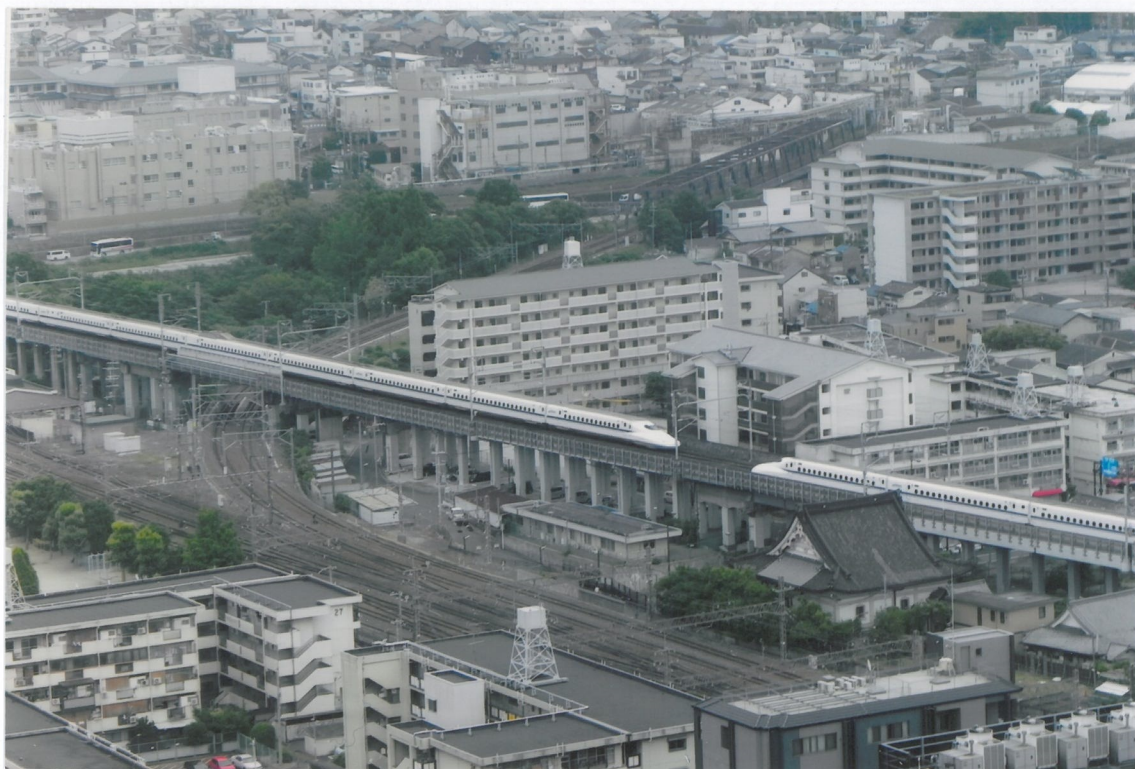
Поглед са највишег објекта у старој престоници Земље излазећег сунца према источном улазу у станицу Кјото (из правца Токија). Мимоилажење два суперекспреса (колосек 1 435 mm).